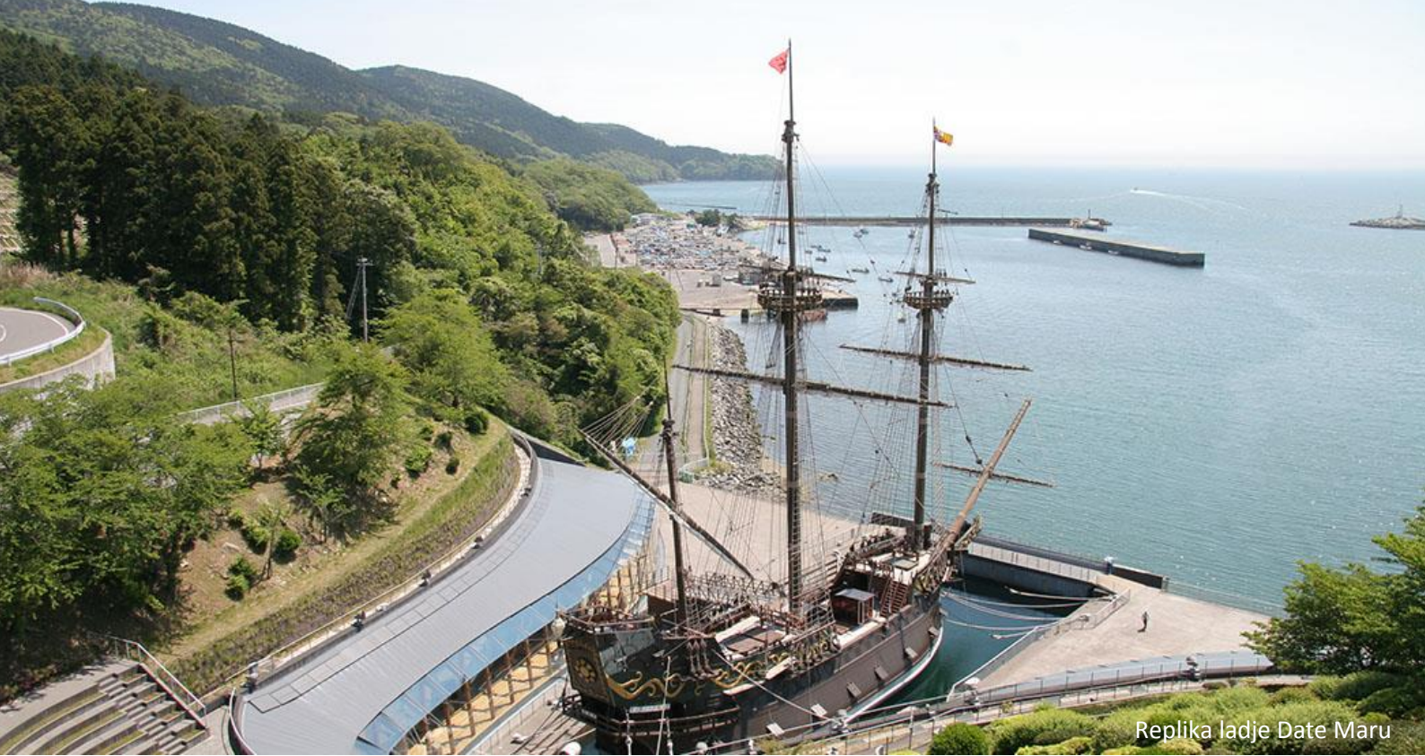
Replika ladje Date Maru